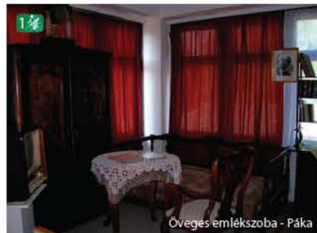
Öveges emlékszoba - Páka

A kerékpározás szerelmeseinek igazi kikapcsolódást nyújthat ez a túraútvonal variáció. Az Öveges Övezet túra már elnevezésében is árulkodó, a híres fizikusról viszont kevesen tudják, hogy Pákán, ezen a kis Zala megyei településen született. Az érdeklődők megismerkedhetnek a helyi általános iskolában berendezett emlékszobában az érdekes fizikai kísérletekkel, amikkel a professzor időről időre a tv képernyője elé szegezte nézők ezreit.